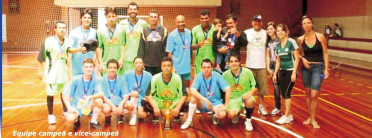
Equipe campeã e vice-campeã